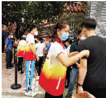
党员志愿者在现场维持秩序。