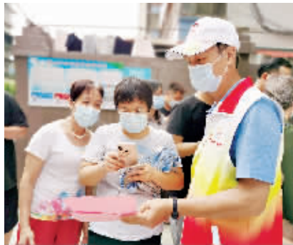
党员志愿者指引居民扫码登记。