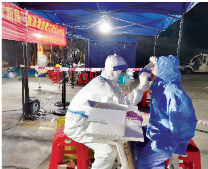
车陂街有序开展核酸检测工作。

据悉,此次爱心企业捐赠了饮料、矿泉水、牛奶、咖啡、八宝粥、N95口罩、普通口罩、洗手凝胶、面罩、护目镜、帐篷和桌椅等物资。同时,爱心市民也送来凉茶、水果等,慰问核酸检测现场的工作人员,为助力疫情防控贡献力量。