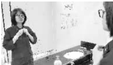
接警员上岗前，整理仪容。

记者了解到，接警员需要从报警人的电话中获取必要的重要信息并记录下来；做好安抚群众和引导群众等待救援前的一些自救措施；第一时间立案调派车辆出动；联系好联动单位出动；全程跟踪警情，多方联系了解现场情况；跟消防队做好信息对接和任务安排等工作。