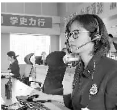
对于接警员来说，她们必须在电话挂断后30秒内发出调派指令。