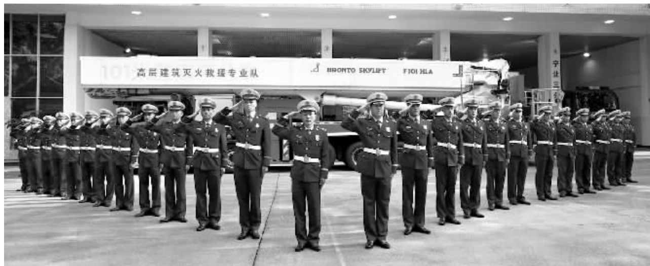
在广州市天河区珠江东消防救援站辖区,连续 11 年未发生亡人事故火灾。