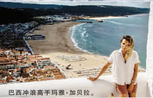
巴西冲浪高手玛雅·加贝拉。

11月18日是吉尼斯世界纪录日。《吉尼斯世界纪录大全》在1974年首度成为全球销售量最大的版权著作,并从2004年开始举办“吉尼斯世界纪录日”庆祝这项成就。每年的吉尼斯世界纪录日,也成了全球挑战者关注的日子。