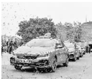
投入春运的新款纯电出租车。

据介绍,新款出租车属于纯电式的新能源车辆,续航能力更强,日常使用每天只需充电一次,车厢内环境更宽敞舒适。“的哥”巫师傅表示,驾驶新款的纯电出租车,在广州市区内充电也相当方便,基本上中途快充半个多小时即可维持一天运营。