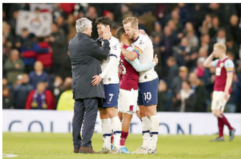
穆里尼奥赛后与孙兴慜亲切拥抱。

信息时报讯(记者白云)昨天凌晨,2019/2020赛季英超联赛第16轮,穆里尼奥麾下的热刺坐镇主场5:0横扫伯恩利。这是2015年1月份以来穆帅第一次率队赢得5球大胜。