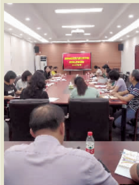
龙洞街定期组织召开在职党员回社区工作部署会。

下一步,龙洞街将深入推进在职党员回社区开展服务活动,充分发挥在职党员在参与社区建设、服务社区居民中的先锋模范作用,努力营造在职党员“一个党员一面旗,服务奉献双岗位”的良好氛围,以新担当开创党建引领基层社会治理新常态。