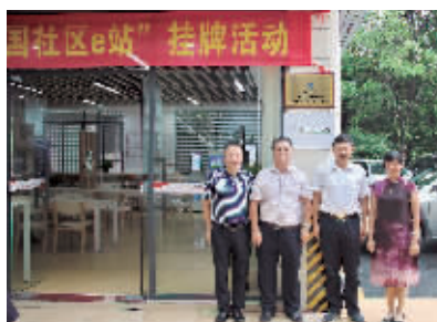
“科普中国社区e站”在龙洞街道党群服务中心挂牌。

信息时报讯 (记者 刘展萍)为推进科普中国落地应用,构建线上线下相结合的科普信息化服务新阵地,以点带面精准提高社区居民的科学素质,8月23日下午,广州市科协、天河区科协、龙洞街道共同举办龙洞街道党群服务中心建设“科普中国社区e站”挂牌活动。市、区科协及龙洞街道相关人员出席本次活动。