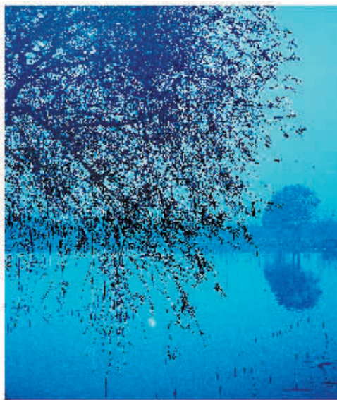
《“月”在湖心处》

每年中秋节，一票摄影发烧友都会端起他们的长枪短炮，找到拍摄月亮的最佳位置，只等着圆月出现那一霎那按下快门。其实，月亮每年还是那个月亮，如何能拍出创意来，让它成为朋友圈里最吸引人的一张最佳“月照”，靠的当然不仅仅是设备，更是创意，以及善于发现美的眼睛。