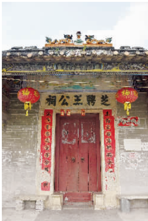
芝聘王公祠装饰考究。