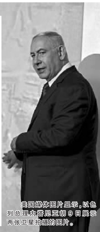
美国媒体图片显示，以色列总理内塔尼亚胡9日展示两张卫星拍摄的图片。

色列中间派联盟蓝白党领导人之一、前财政部长亚伊尔·拉皮德说，这是内塔尼亚胡再一次利用情报做竞选宣传。拉皮德认为：“伊朗核(问题)不能用于竞选把戏。”新华