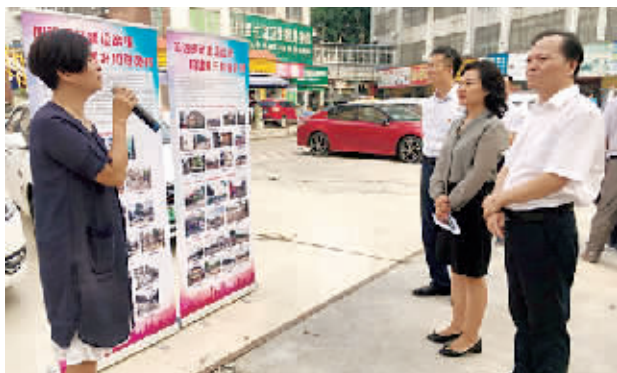
天河区人大开展员村街违法建设治理工作情况调研。

现场,调研组听取了员村街道办事处关于近年来员村辖内违法建设治理工作的情况汇报。据悉,今年7月2~4日,员村街依法依规对白水塘通惠水果市场进行拆除。该处违建始建于2006年,占地面积2863平方米。由于该处违法建设涉及经济利益纠纷,执法难度大,员村街道高度重视,深入细致做好业主方的思想工作,顺利对该处历史违建完成拆除。现阶段,员村街道办事处