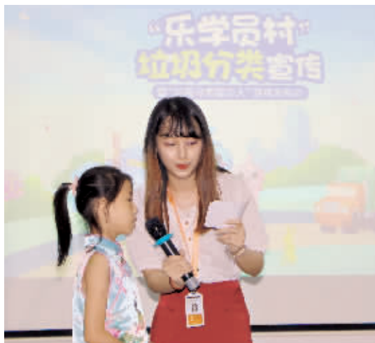
◀发布会现场,游戏研发团队现场为大家演示了游戏的玩法。