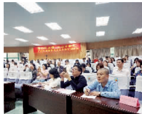
广州市南国学校举行家训家风培训讲座。

此次活动,充分践行了南国学校“培育滋润土壤,成就健康人生”的办学理念,使广大家长和老师树立了正确的家庭教育观念,掌握科学的家庭教育方法,提高科学教育子女的能力。