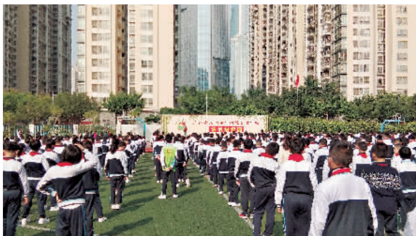
誉城苑居委会联合天河中学猎德实验学校举行宪法和国家安全法宣讲。

本次宣讲在全校范围内掀起了学习、宣传宪法精神的热潮,引导广大师生学习宪法、遵守宪法、维护宪法、运用宪法,促进广大师生法治文明素质的提升,对青少年健康成长起到了良性引导作用。