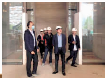
猎德街到周大福金融中心进行安全生产消防安全督查检查。

猎德街将落实属地监管责任,做好安全监督管理工作,加大监管力度,及时发现和消除各类安全隐患,有效防范和遏制各类事故发生,落实企业主体责任,确保辖内安全生产、消防安全形势的稳定。