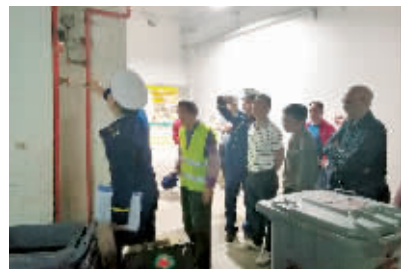
猎德街到猎德市场开展消防安全隐患联合检查。

在现场,检查组一行人听取了农贸市场相关负责人关于消防安全工作的情况汇报并对市场消防审批手续、消防安全管理工作的落实情况、电器线路是否合乎规范、消防通道是否通畅等进行检查,强调市场相关负责人要高度重视农贸市场消防安全问题,加强日常监督管理工作,做好自查自纠,同时加强员工消防安全培训,完善好消防相关台账资料,将企业主体责任制落地,确保消防安全工作真正落