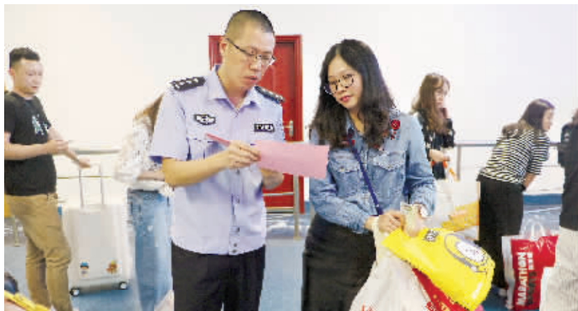
开展普法宣传,帮助旅客熟悉了解出入境有关法律法规。

尾随他人自助过关,会被处罚吗?为了让广大旅客了解掌握出入境法律法规,在全民国家安全教育日即将到来之际,东莞出入境边防检查站常平分站在站内开展普法宣传,帮助旅客熟悉了解出入境有关法律法规。