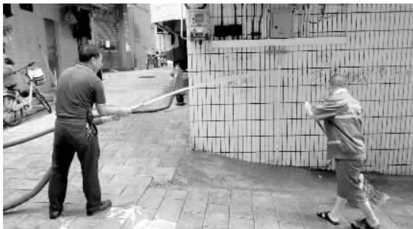
工作人员正在清扫原垃圾桶摆放位置。

信息时报讯 (记者 刘诗敏) 屋前屋后干净整洁是宜居环境的首要条件,也是街坊们安心定居的基本需求。如何创造宜居环境?白云区景泰街长安社区议事会,从社区垃圾桶摆放抓起,为居民创造了干净整洁的宜居环境。