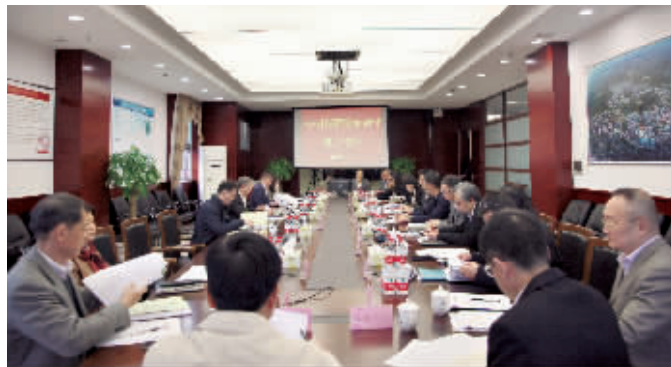
天河科技园党委召开2018年度处级以上党员领导干部民主生活会。

为指导,增强“四个意识”、坚定“四个自信”、做到“两个维护”,坚定共产主义理想信念,践行为人民服务的宗旨,有计划、有步骤、有效力提升园区发展品质。二是要加强作风建设,坚持以问题为导向,着力整治形式主义、官僚主义,筑牢防线守好底线,严格遵守“八项规定”,依法依规做好征地补偿、企业服务工作,营造亲清政商关系,助力企业发展更大、更快、更好。三是要保持高昂的精神状态,坚决克服、改进不想为、不敢为、不作为问题,不断增强使命感、责任感、紧迫感。始终坚持和贯彻新发展理念,牢牢把握粤港澳大湾区、广深科技创新走廊建设等重大战略机遇和申报国家级高新区的历史机遇,推动天河科技园各项