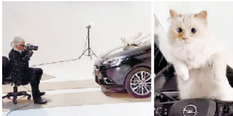
“老佛爷”卡尔·拉格斐为爱猫Choupette拍大片。

生前每每谈起爱猫，“老佛爷”总是一脸宠溺，说“公主”很喜欢在公园散步，在花园嬉闹，还喜欢逛商场。他甚至将Choupette比作传奇女星葛丽泰·嘉宝：“它就是宇宙的中心！当你看到它，你就会明白。”