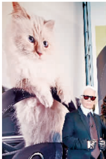
▶“老佛爷”卡尔·拉格斐亮相与爱猫Choupette相关的活动。