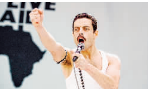
▲▼《波西米亚狂想曲》聚焦皇后乐队主唱佛莱德的生平，少不了提到他的爱猫。