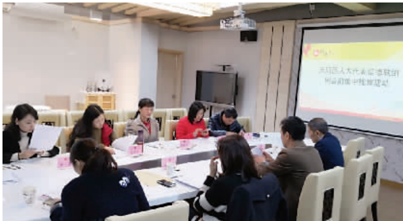
天河区人大代表猎德联组开展例会前集中视察活动。

信息时报讯(记者 梁雨琦 通讯员 迟洪双)1月8日,天河区人大猎德街道工委组织联组人大代表一行9人前往猎德幼儿园进行天河区人大代表猎德联组例会前集中视察活动,并对猎德幼儿园进行实地走访调研。