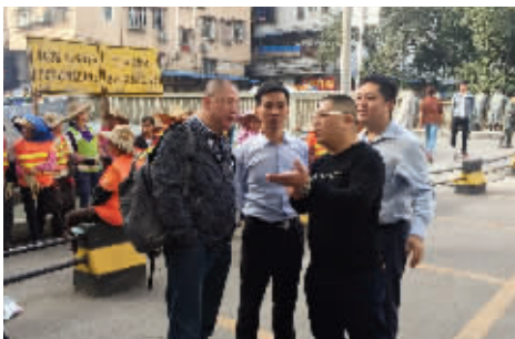
“百人洗河”专项行动当天,街道领导到现场进行工作部署。