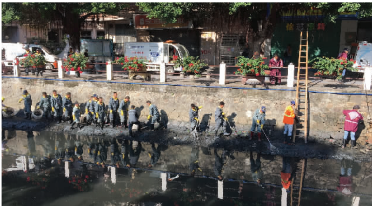
近日,瑞宝街重点对辖区内石溪、瑞宝两大河涌开展“百人洗河”专项行动!

记者了解到,根据《广州市治水三年行动计划》安排,海珠区河涌所还分别对瑞宝村、石溪村的内部分排水管道进行系统优化设计和改造,全程改造免费。据悉,瑞宝村改造范围约96公顷,涉及房屋约2870栋;石溪村改造面积约115公顷,涉及房屋约2720栋。目前工程已进场施工,计划将于明年12月完工。