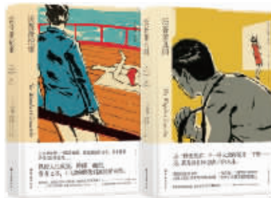
《沃普萧记事》《沃普萧丑闻》 (美)约翰·契弗 著 朱世达 译 译林出版社 2018年10月

为是继海明威之美国短篇小说的典范。日前这位小说巨匠的作品首次被译林出版社大规模引进出版,将推出他的作品集共五本,其中首批是“沃普萧系列”的两部长篇《沃普萧记事》和《沃普萧丑闻》,前者是契弗的处女作长篇,出版后即荣膺美国国家图书奖。2019年译林出版社还将出版《约翰·契弗短篇小说集》(收录61篇精选故事)和约翰·契弗的中篇小说《弹园之地》、《恰似天堂》。《沃普萧记事》讲述的是圣博托尔夫斯的沃普萧家族,《沃普萧丑闻》是《沃普萧记事》的续篇,书中满是受制于无常命运的可怜人物,最重要的是,同为人类本性的囚徒,契弗对