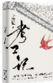
王安忆 著 花城出版社 2018年9月

《考工记》本是战国时期的一部手工业技术文献,记载了各种工艺的规范及体系。王安忆写的《考工记》却是带着历史的长焦,描述住在祖宅中的上海洋场小开逐渐蜕变成普通劳动者的过程。半个多世纪前的“西厢四小开”,各自走完了自己的人生路。他们是千万上海工商业者的缩影,是上海这座繁华都市的沧桑注脚。这是继《长恨歌》之后,王安忆书写的又一部低回慢转的上海别传。