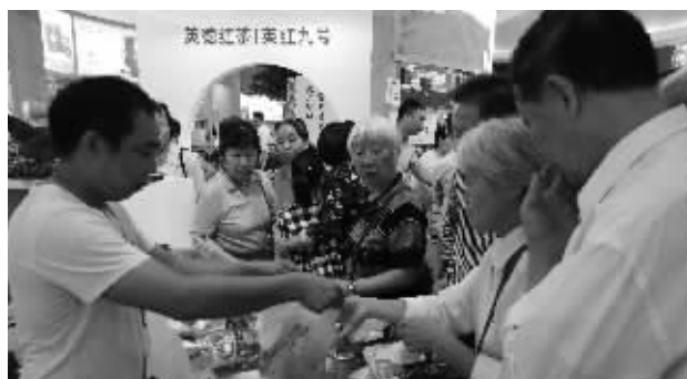
昨日,很多市民赶到展馆内选购农产品。

“最后大甩卖,超级抵啦!”在惠州某粮油食品有限公司展位,工作人员正可劲地叫卖着最后几袋大米。有工作人员告诉记者,9日和10日两天,试吃的多,11日这天这些试吃的就成了回头客,尽