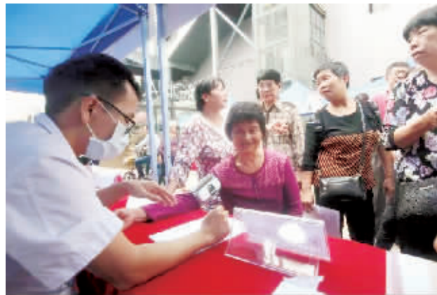
活动现场,社区卫生服务中心医生为街坊义诊。

此外,为解决社区卫生服务中心药品尚未与大医院完全实现对接的实际问题,番禺区卫计局还借香港联合医务集团番禺工作室启用的契机,以桥南社区卫生服务中心为试点,率先引入“云药房”服务。患者在社区卫生服务机构用药目录以外的高血压、糖尿病用药,可通过“云药房”采购,并由有资质的药品配送商通过快递方式配送给患者,彻底解决社区卫生服务机构与大医院用药目录不对接的问题。据悉,“云药房”试运行结束后,将在番禺各社区卫生服务中心推广使用。