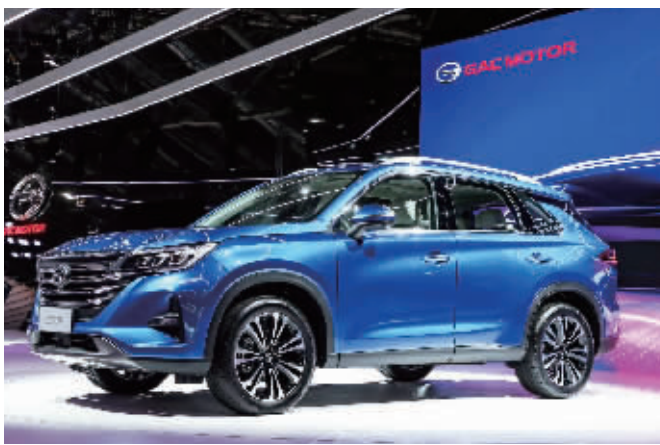
广汽传祺携全新传祺GS5等车型首度参加巴黎车展。

在销量萎靡的同时,国内汽车产业的利润水平也正在持续下滑。据国家统计局公布的数据,2017年,我国汽车行业的销售利润率为8%,利润率已经连续三年下滑。进入2018年,这一趋势依然未能得到扭转。今年1~7月,汽车制造业的销售利润率是7.7%。今年8月,汽车类商品零售额为3239亿元,同比下降3.2%。自此,汽车类商品零售额连续第四个月出现同比下降态势。