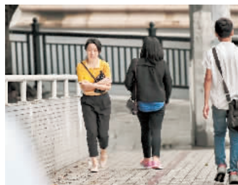
▲昨天下午,广州大道南,路人冷得抱着手臂前行。