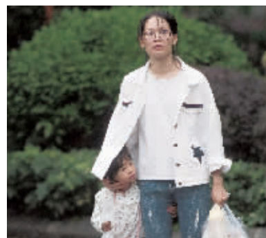
昨天下午,麓景路附近,一名家长用外套为孩子挡雨。

有冷空气,有雨水,而且雨水比此前预测的大,10日五山观测站录得的气温比此前的要低许多。据广州市气象台统计,10日上午6时、8时、10时、12时和14时,五山观测站录得的气温分别为22.1℃、22.1℃、22.3℃、22.9℃和21.9℃,较9日同期分别下降了1.8℃、3℃、5℃、4.8℃和8.6℃。9日下午2时,五山观测站录得的气温30.5℃也是当天录得最高气温,而10日该观测站录得最高气温却出现在12时,下午2时气温已下降,两个小时内下降了1℃。9日,广州市气象台给出的预测是五山观测站10日的最高气温为27℃。