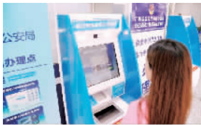
旅客在自助设备前办理临时乘机证明。

据统计,临时乘机证明办证设备自8月20日投入使用以来,已服务旅客3600余人次,切实解决了群众办证排队、提交材料繁琐等问题,大幅提升了办证效率,优化了广大旅客的出行体验。