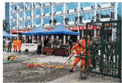
技术装备大比武活动现场。

8月21~24日,东莞市公安消防局组织全市15个现役消防队、20个专职消防队开展装备大比武活动,比武分为技能比武和理论比武两部分,通过随机抽考的方式营造了全员参训、全员参考的浓厚练兵氛围。