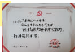
云山勤工党支部获全国先进基层党组织证书