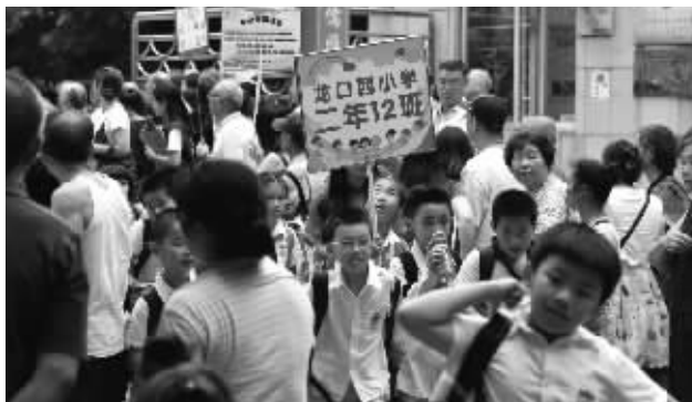
龙口西小学,二年级的学生排队放学。

近日,广州市多个区公布了小学招生政策。记者发现,今年天河区、越秀区的公办小学有不少扩班的,其中天河区公办小学增加了42个班,招生规模连续3年攀升。据了解,2012年出生的“龙宝宝”今年适龄入学,相较往年人数更多一些。为应对入学潮,各区教育局也提前采取措施,如越秀区教育局在积极协调各方资源,采取多种措施保障教学场地和资源配置;天河区教育局今年提前分配了教师的编制数量给学校,以保证师资力量等。